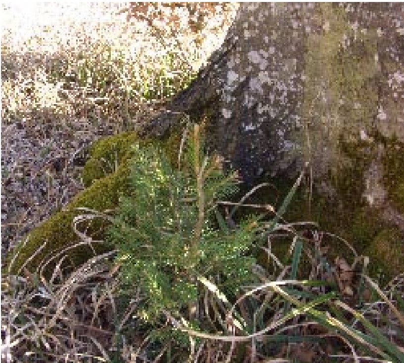
ABBILDUNG 4: Schalenwildverbiss an Fichtennaturverjüngung – ein untrügliches Zeichen überhöhter Wildbestände.