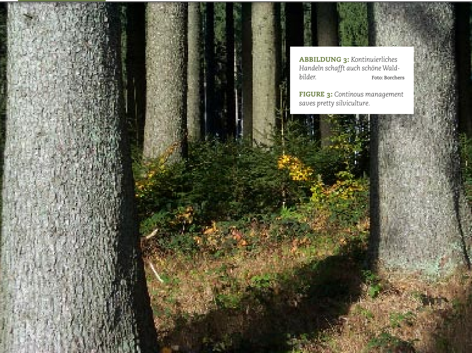
ABBILDUNG 3: Kontinuierliches Handeln schafft auch schöne Waldbilder.